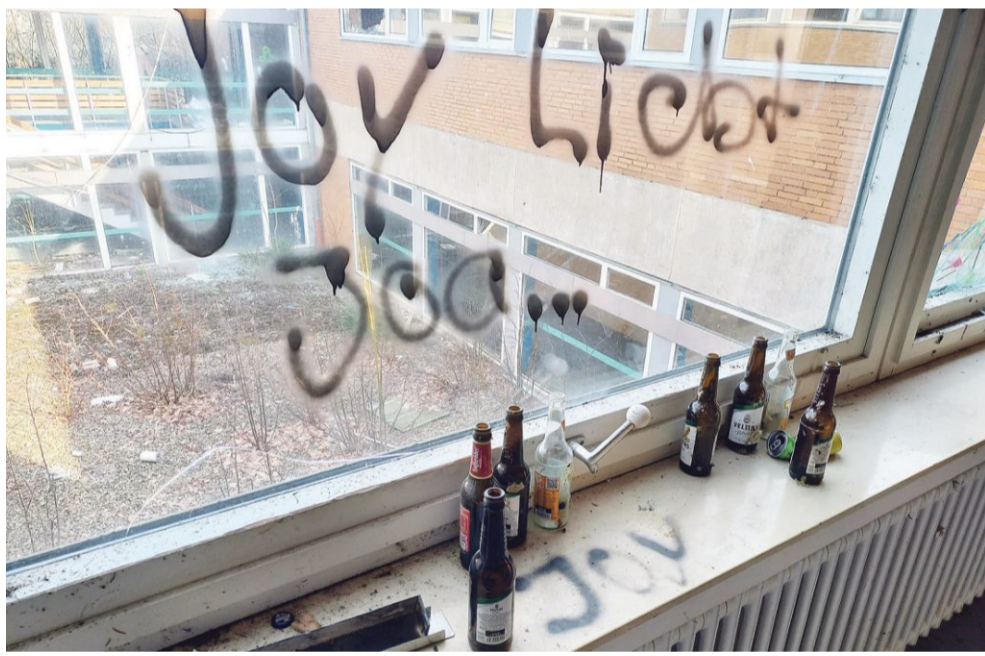
Vermeintlich ein Treffpunkt für junge Menschen: Leere Flaschen und gesprühte Liebesbotschaften sind in einem der Schulflure im Obergeschoss zu sehen.