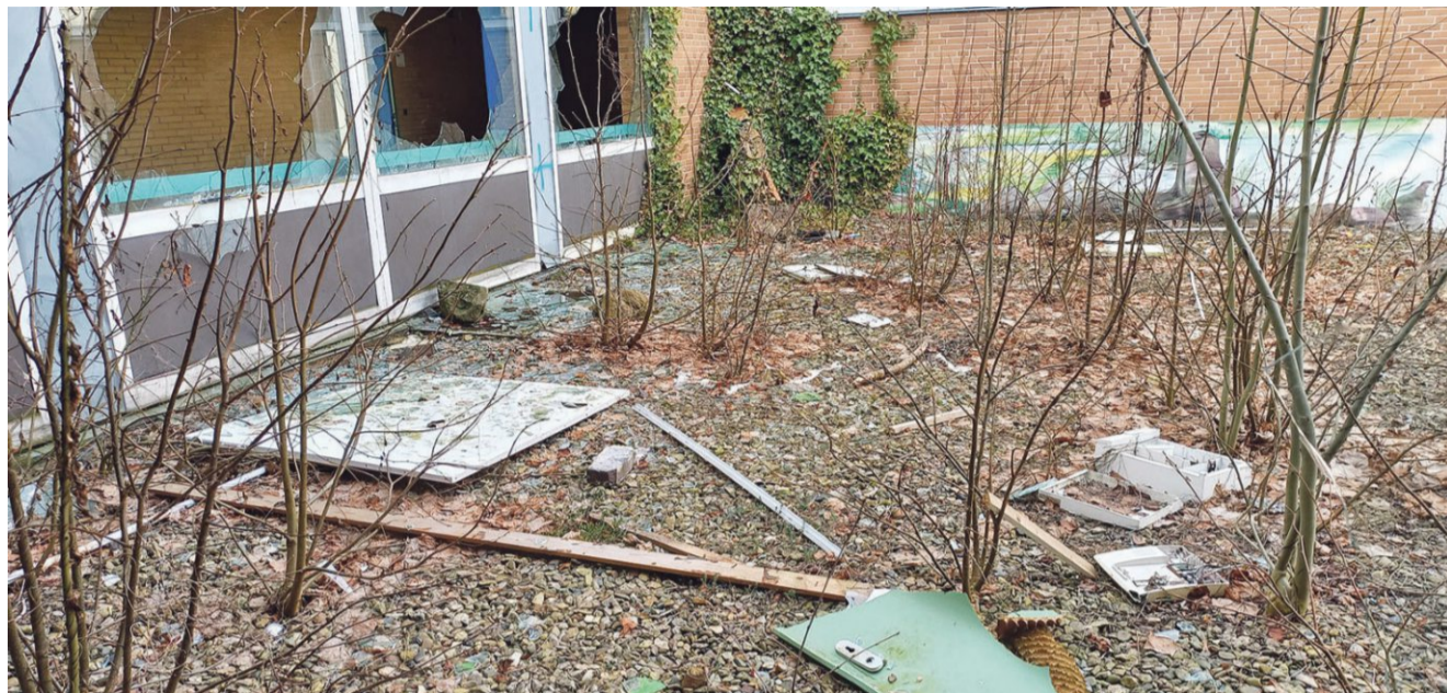
Zerstörte Scheiben und Trümmer im Innenhof: So sieht es derzeit bei der ehemaligen Krüger-Adorno-Schule aus.